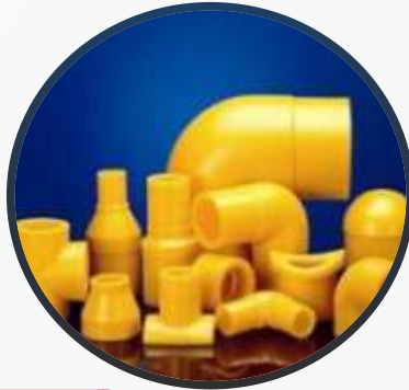
Butt Welding / Butt Fusion