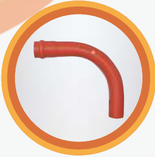
Bell Bend 90°