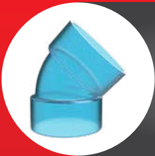
TRANSPARENT FITTING ELBOW 45° (D)