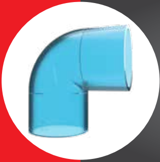
TRANSPARENT FITTING ELBOW 90° (AW)