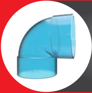
TRANSPARENT FITTING ELBOW 90° (D)