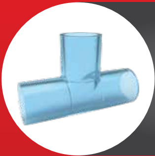
TRANSPARENT FITTING TEE (AW)